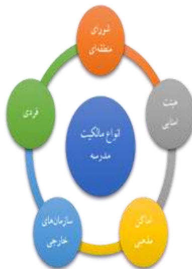
نمودار ۱. انواع مالکیت مدرسه

بسته به نحوه مالکیت مدرسه که می‌تواند یک یا ترکیبی از حالت‌های زیر باشد، مدرسه از حالت صرف دولتی بودن خود خارج می‌شود و جزو مدارس غیردولتی دسته‌بندی می‌شود: